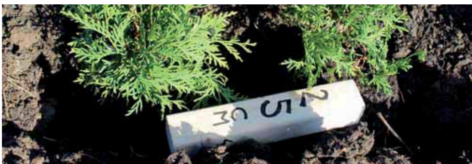
Räv = Måttstock/ träbit som kapats i rätt längd som mall.

22,5 meter / dividerat med antal beställda och levererade plantor MINUS 1 st Planta dvs 59 st = Minusplantan går bort som start. Så 22,5/59 = 0,38 cm. Plantera nu Första plantans stam exakt där häcken skall börja, såga sedan till en sk "räv" (träbit) på 38 cm som använder som måttstock. Använd sedan denna Räv för att få exakt samma avstånd mellan plantorna, och ni kommer då få exakt samma mellanrum mellan plantorna, de kommer även att räckta hela vägen precis till slutet.