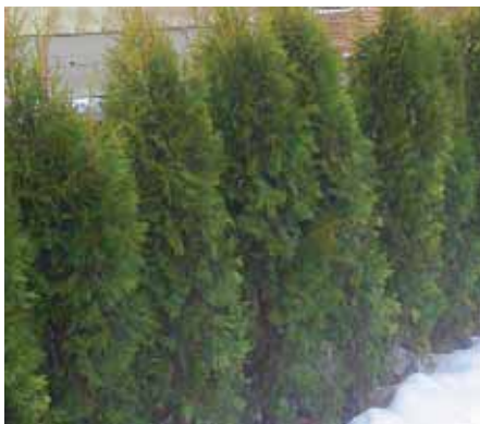
Häck utan täckning.