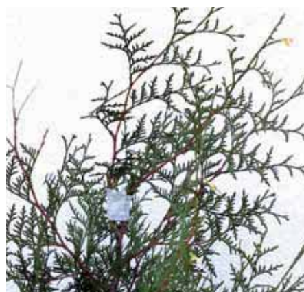
Uppbunden ny topp med ståltråd.