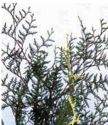
Bort klippt topp.