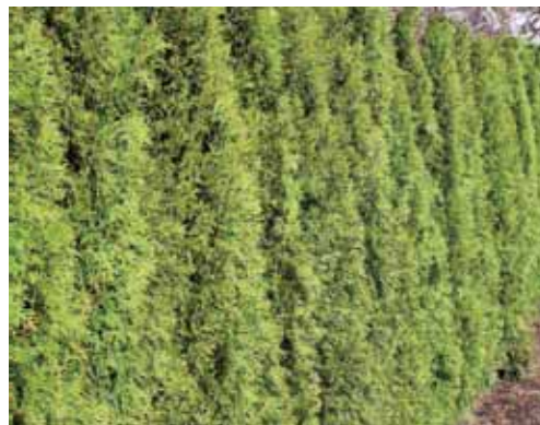
Så här fin var häcken efter avtäckning.