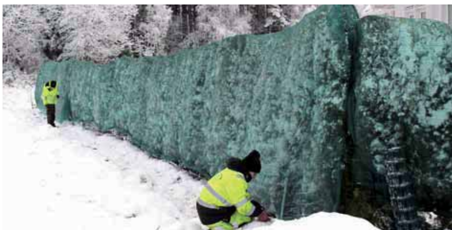
Täckning av snöklädd häck.