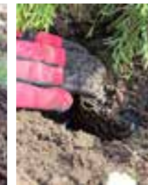
Kontrollera plantans nivå så att rötterna täcks av jord.