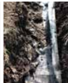
Lägg ut en skiktduk.