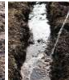
Vattna i diket / eller blötlägg plantan.