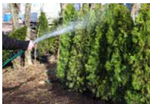
Vattna din nyplantering, tvätta händerna och njut.

Har du nu funderingar om din plantering, så följer i denna folder många svar.