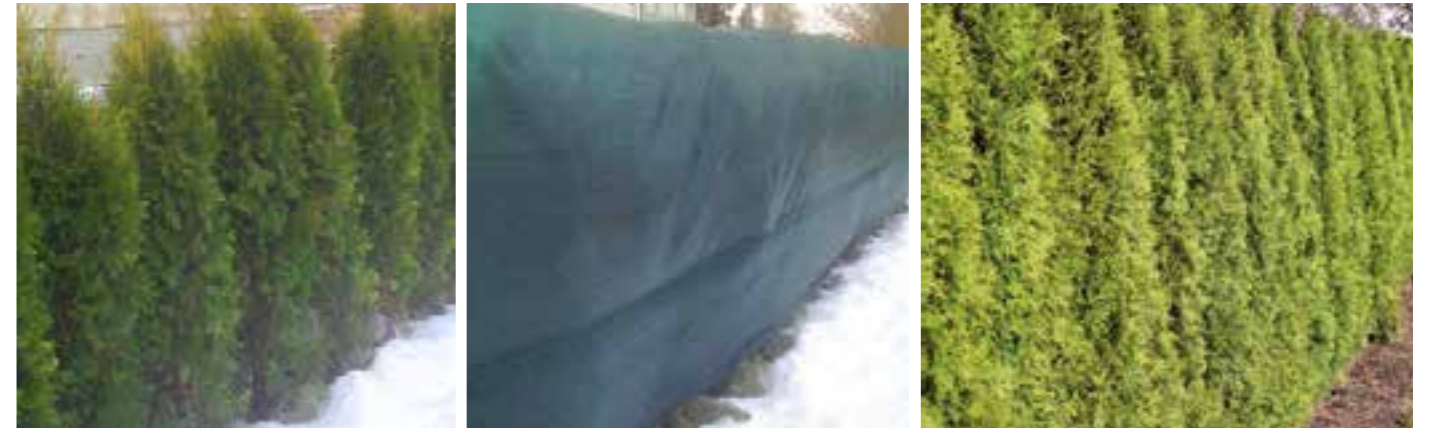
Häck utan täckning.