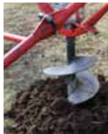
Gräv eller borra ett hål för plantan.