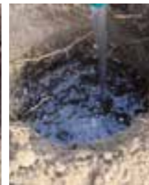
Fyll hålet med vatten /eller blötlägg plantan.