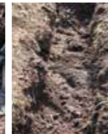
Bottna med jordförbättring.