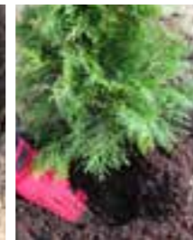
Ta bort krukans och plantera.