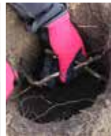
Rensa hålet från jord, rötter och stenar.