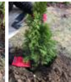
Tryck fast plantan med jord. Eventuellt dränera.