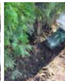
Trampa fast jorden.