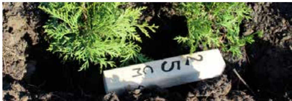
Räv = Måttstock/ träbit som kapats i rätt längd som mall.

22,5 meter / dividerat med antal beställda och levererade plantor MINUS 1 st Planta dvs 59 st = Minusplantan går bort som start. Så 22,5/59 = 0,38 cm. Plantera nu Första plantans stam exakt där häcken skall börja, såga sedan till en sk "räv" (träbit) på 38 cm som använder som måttstock. Använd sedan denna Räv för att få exakt samma avstånd mellan plantorna, och ni kommer då få exakt samma mellanrum mellan plantorna, de kommer även att räkka hela vägen precis till slutet.