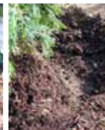
Finjustera så du får den linje på din häck som du önskar.