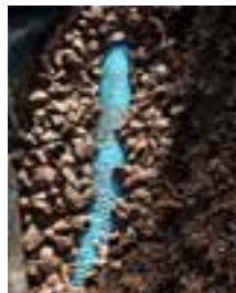
Gräv ur och dränera