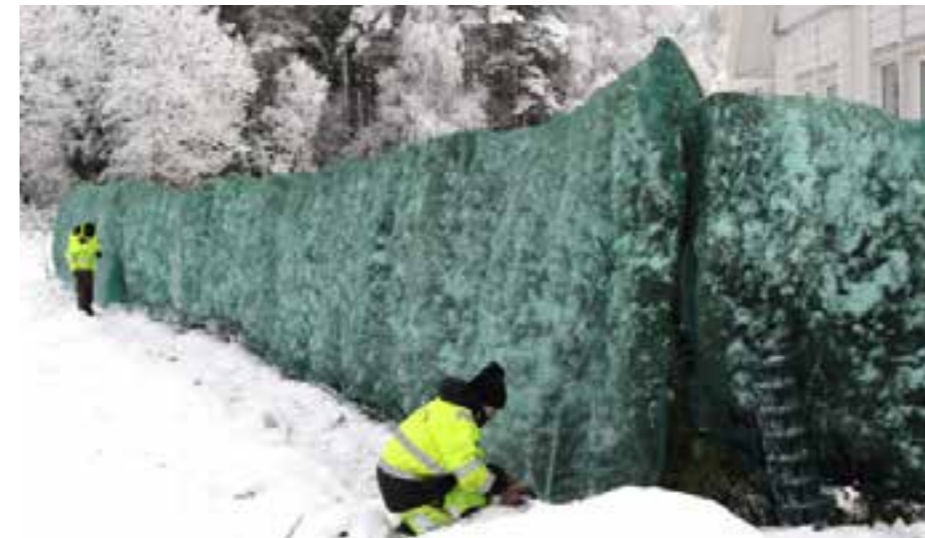
Täckning av snöklädd häck.