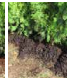
Lägg ut täckbark.