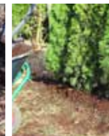
Fyll på med mera jord.